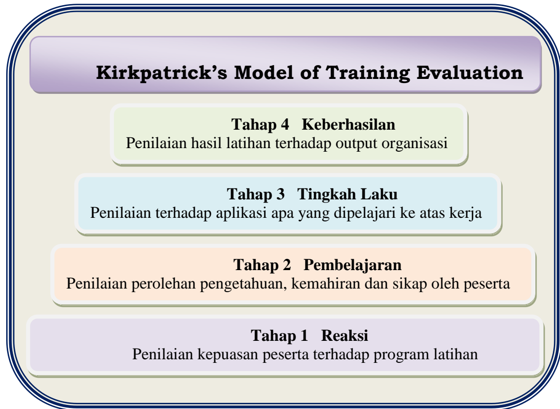
Rajah 1 : Model Kirkpatrick's

to it". Yang lebih utamanya model ini membincangkan bagaimana dan mengapa (why) atau sebab sesuatu penilaian itu perlu dilaksanakan, iaitu objektif penilaian itu sendiri.