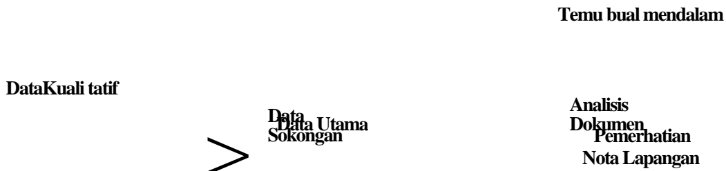
Rajah 3.1 Kedudukan Reka Bentuk Kajian Kes Kajian Kualitatif

Data yang dikumpul dan dianalisis diambil dari pelbagai tempat lapangan kajian. Pengkaji mengambil reka bentuk kajian pelbagai kes dengan mengikut pendekatan yang digunakan oleh Kamarul Azmi Jasmi (2010) dengan sedikit pengubahsuaian mengikut kesesuaian situasi pengkaji. Menerusi kajian ini, pengkaji menggunakan kaedah temu bual separuh struktur sebagai sumber data utama. Sokongan data datang dari kaedah pemerhatian pada sampel kajian serta penelitian dokumen menerusi analisis dokumen yang berkaitan. Bagi memperkukuhkan data-data tersebut, pengkaji menggunakan nota lapangan dan diari sebagai pengukuhan. Kaedah nota lapangan ini juga digunapakai oleh Kamarul Azmi Jasmi (2010) dan Mohd. Azhar Abd. Hamid (2013) dalam kajian mereka. Melalui pendekatan kualitatif dan kaedah yang digunakan, pengkaji akan melihat secara menyeluruh kesemua ciri dan elemen kecemerlangan dalam diri Pensyarah Cemerlang Pendidikan Islam (PCPI). Ciri tersebut ialah corak P&P berkesan, aspek keperibadian, penguasaan ilmu, kegiatan penyelidikan, kemahiran yang dimiliki, serta aspek pengamalan Islam yang diamalkan dalam kehidupan. Gambaran reka bentuk kajian ini adalah seperti Rajah 3.1: