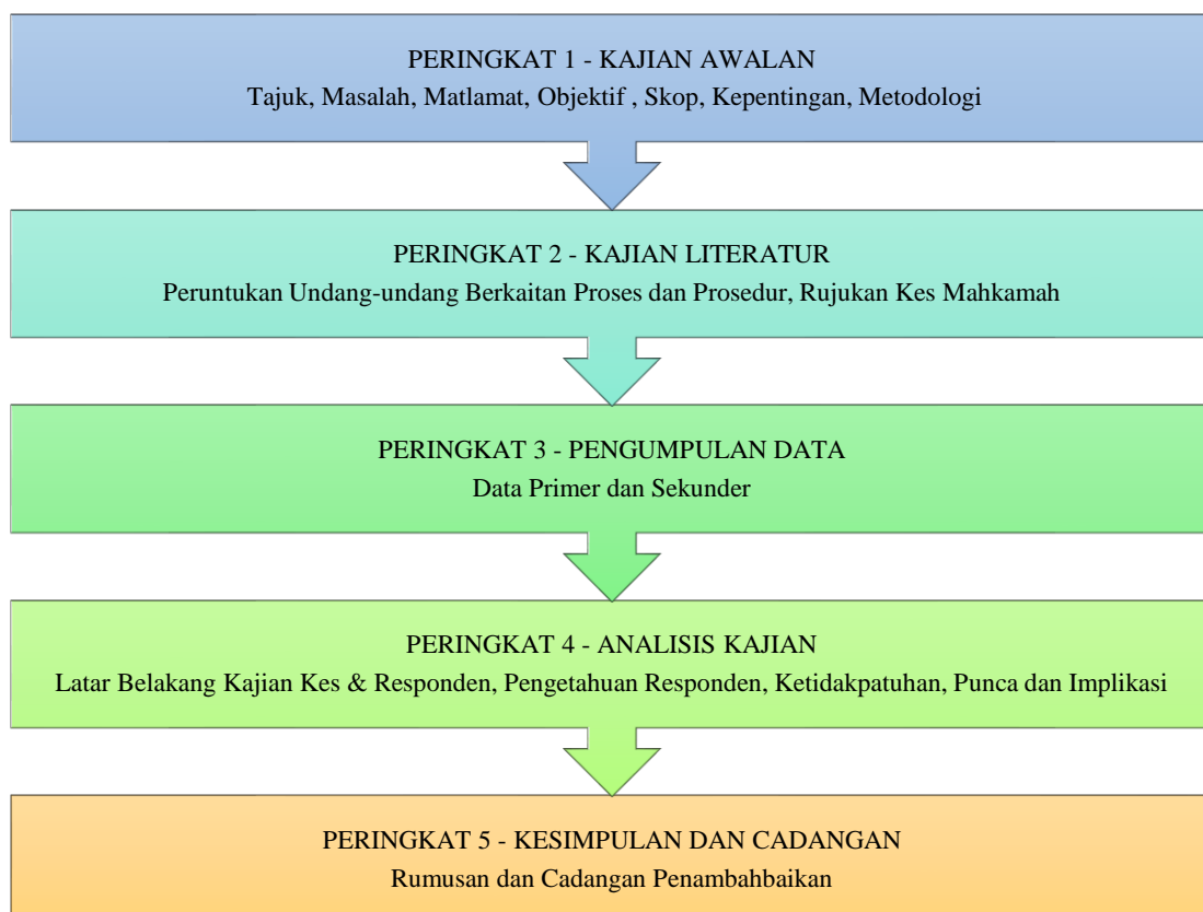
Rajah 1.1 Carta Alir Peringkat Kajian

Metodologi sebagaimana maksud Kamus Dewan Edisi Keempat adalah sistem yang merangkumi kaedah dan prinsip dalam satu kegiatan. Metodologi kajian akan merangkumi kaedah dan tatacara bermula dari peringkat kajian awalan, kajian literatur, pengumpulan maklumat, analisis data dan kesimpulan yang menerangkan pencapaian objektif kajian. Kajian ini akan dilaksanakan dengan melalui lima (5) peringkat.