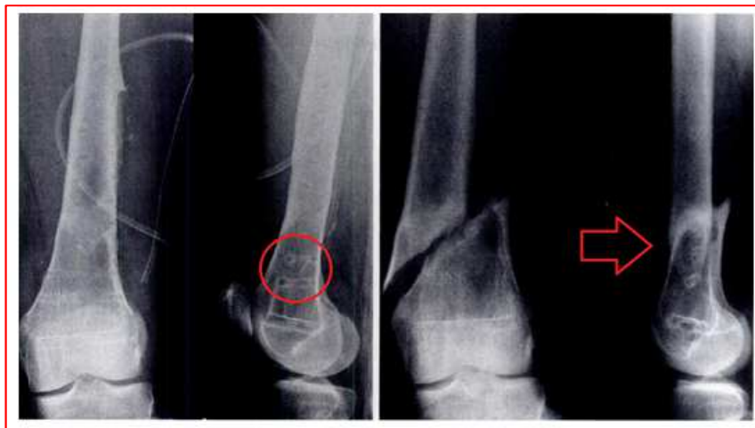
Rajah 1.2 Imej radiografi, tulang di bahagian lubang skru patah semula selepas 3 bulan penanggalan implan plat [15].

15, 27, 28]. Mengikut statistik, patah kembali yang berlaku pada bekas lubang skru adalah sebanyak 38.1% dan pada bekas patahan adalah sebanyak 14.3% [6].