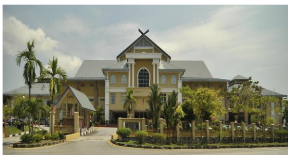
Pejabat Daerah Seremban

pelbagai ciri yang melambangkan identiti dan kebanggaan negara berkenaan. Contoh bangunan mercu tanda seperti ini adalah Eiffel Tower di Perancis, Opera House di Australia, Menara Berkembar Petronas, Kuala Lumpur City Centre (KLCC) di Kuala Lumpur dan banyak lagi. Begitu juga di Malaysia, setiap negeri dan daerah mempunyai bangunan mercu tanda masing-masing. Bangunan pejabat daerah berfungsi sebagai pusat pentadbiran daerah yang menjadi ikon atau identiti setempat. Begitu juga setiap negeri di Malaysia yang mempunyai gaya seni binanya yang menyerlah seperti istana, bangunan pentadbiran negeri, masjid dan sebagainya. Bangunan-bangunan seperti ini biasanya menjadi ikon mewakili identiti negeri tersebut. Di peringkat negeri, dalam konteks yang lebih kecil setiap daerah di Negeri Sembilan bangunan pejabat daerah menjadi ikon daerah. Variasi seni bina bangunan pejabat daerah di Negeri Sembilan yang menjadi ikon tempatan dengan kepelbagaian gaya seni bina bangunan seperti terdapat pada gambarajah di bawah.