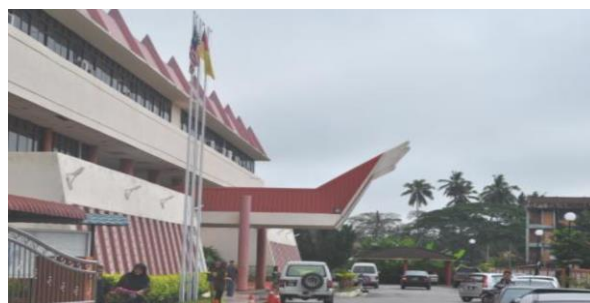
Pejabat Daerah Kuala Pilah