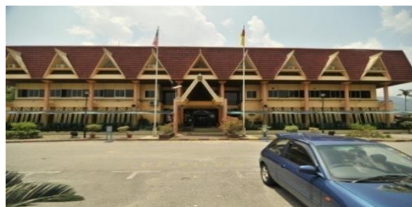
Pejabat Daerah Rembau