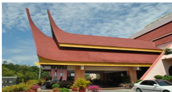
Pejabat Daerah Jelebu