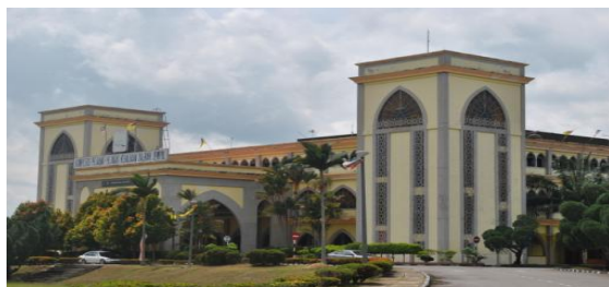
Pejabat Daerah Jempol