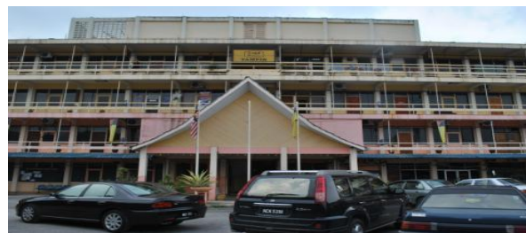
Pejabat Daerah Tampin