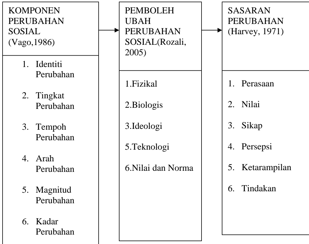
Rajah 1 Kerangka konseptual kajian