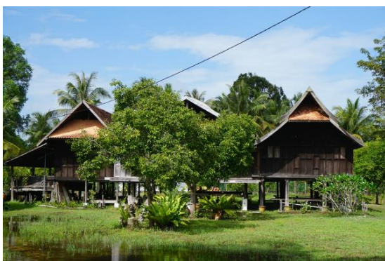
Gambarajah 1.1: Rumah Melayu berusia 200 tahun ini dipindahkan dan dibina semula oleh Nik Rashiddin, sekarang dijadikan akademi untuk meluaskan penghayatan mengenai warisan ukiran kayu Melayu.

terletak kurang satu kilometer daripada pantai di daerah Bachok, Kelantan. Ia dikelilingi oleh pokok-pokok kelapa dan alam semulajadi dalam suasana kampung yang damai. Sebuah rumah tradisional Melayu yang telah berusia 200 tahun dibeli dari Kampung Ladang, Terengganu dan dipindahkan dari tapak asalnya untuk dijadikan tempat menyimpan artifak ukiran lama, koleksi ukiran kayu, serta menjadi rumah kajian untuk peminat-peminat seni ukir serta pengkaji senibina rumah Melayu (rujuk Gambarajah 1.1 dan Gambarajah 1.2).