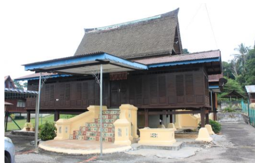
Gambarajah 1.11: Lawatan ke rumah ini yang terletak berhadapan Stesen Minyak Petronas Masjid Tanah sebanyak tiga kali mendapati ianya telah lama ditinggalkan oleh pewaris walaupun mempunyai nilai estetika yang menarik.