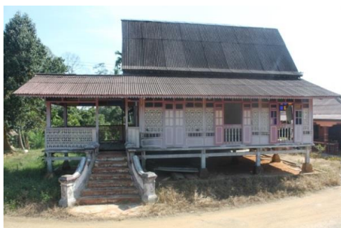
Gambarajah 1.6: Rumah yang terletak di Kampung Rim, Jasin, milik seorang Penghulu pada suatu masa dahulu telah ditinggalkan akibat semua pemilik/waris telah meninggal dunia/berhijrah. Bahagian dinding, tingkap dan lantai rumah mula mengalami kerosakan.