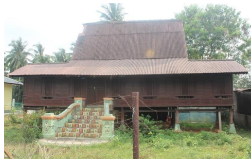
Gambarajah 1.5: Rumah di Kuala Linggi ini telah lama ditinggalkan, dinding pada bahagian sisi rumah telah mereput.