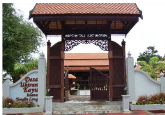
Gambarajah 1.2: Pintu gerbang masuk ke Desa Ukiran Kayu di daerah Besut.

Selain itu, pembinaan Desa Ukiran Kayu (DUK) di daerah Besut, Terengganu juga dilihat sebagai galakan serta pengiktirafan ke atas pengukir-pengukir tersohor negara dari daerah Besut seperti Che Long Yusof, Tengku Ibrahim Tengku Wook yang merupakan Tokoh Kraf Negara 1999, Haji Wan Su bin Othman sebagai Tokoh Seni Negara 1997, Abd. Rahman Long, Wan Mustaffa Wan Su iaitu Tokoh Seni Negeri Terengganu 2003 dan Adiguru Kraf 2007. Pembinaan DUK ini dilihat sebagai manifestasi kepada cogan kata “Besut Daerah Ukiran Kayu” yang telah diisytiharkan pada 12 Ogos 1999 menurut Portal Rasmi Majlis Daerah Besut (2013). Ia merupakan sebuah pusat perusahaan kraftangan terutamanya seni ukiran yang dibina sejak awal 2005 dan siap pada Jun 2007 serta dibuka dengan rasminya pada 21 Februari 2008. DUK dibina di kawasan Istana Tengku Long yang dibina oleh Tengku Chik Haji bin Tengku Hitam, Raja Besut ke-4 pada tahun 1875 yang mempamerkan banyak ukiran kayu yang menarik serta mengagumkan. Pusat ini