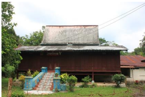
Gambarajah 1.10: Rumah milik Hajah Soyah Agam yang terletak di No.31, Kampung Lubok Kepong, Simpang Ampat, Alor Gajah ini sudah lama ditinggalkan dalam keadaan tertutup dan tidak berpenghuni.