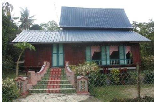
Gambarajah 1.4: Rumah yang terletak di tepi jalan di Rembia ini didapati baru sahaja ditinggalkan oleh pemiliknya.