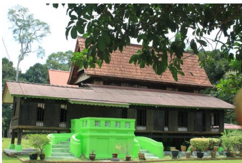
Gambarajah 1.8: Rumah di Taman Ganun, Alor Gajah yang mempunyai nilai estetika yang tinggi ini dahulunya sering menjadi tempat tumpuan dan penggambaran, bagaimanapun telah ditinggalkan pemiliknya.