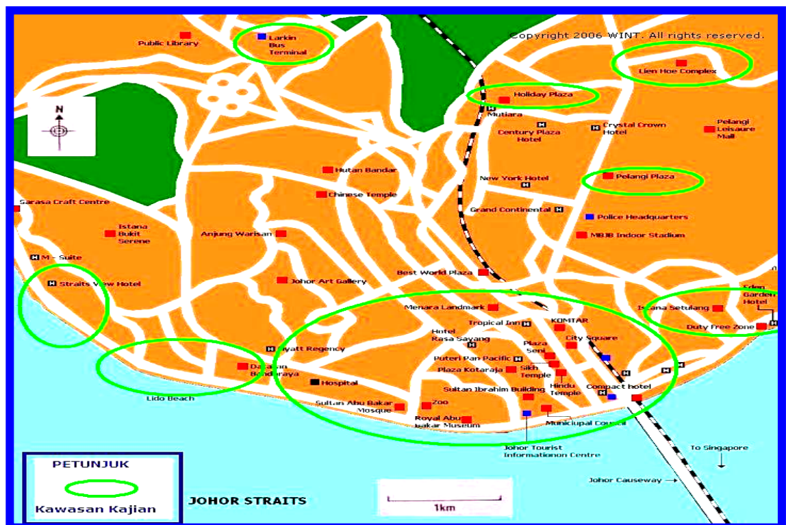
Rajah 1.2: Peta Bandaraya Johor dan Kawasan Kajian