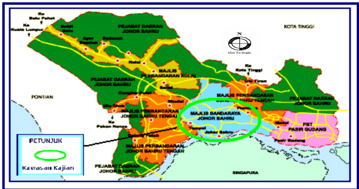
Rajah 1.1: Peta Negeri Johor dan Kawasan Kajian