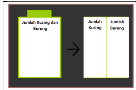
Rajah 2: Rajah Skema Kumpulan