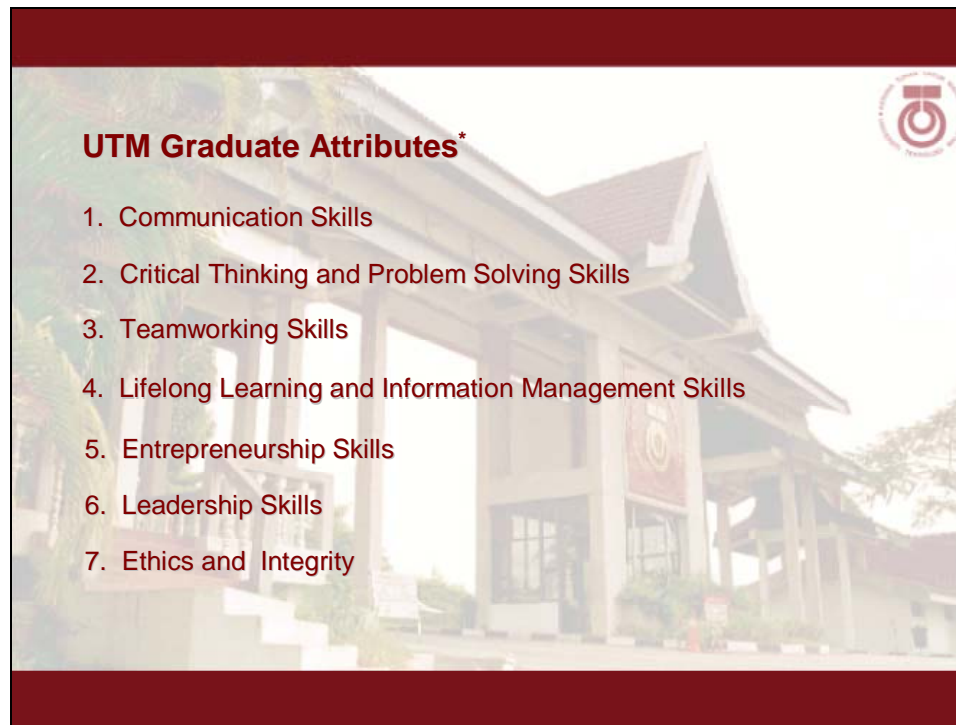
Rajah 2: Senarai Komitmen UTM Dalam Usaha Membangunkan KG Di Kalangan Pelajar (Versi 2 – Januari 2007)