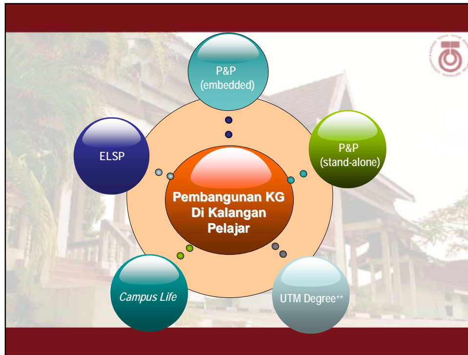
Rajah 3: Model Pembangunan KG Di Kalangan Pelajar