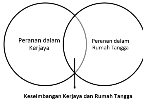
Rajah 5.1 Model asas keseimbangan kerjaya dan rumah tangga

Kebiasaannya wanita walau pun menjawat jawatan yang tinggi mereka tetap akan berusaha menyeimbangkan antara kerjaya dan rumah tangga. Mereka tetap berkemampuan mengendalikan pekerjaan dengan baik. Peluang, sikap yang lebih terbuka daripada majikan serta komitmen daripada anggota keluarga baik suami mahu pun anak-anak merupakan kunci melahirkan wanita yang berjaya (Schwartz, 2000). Bagi memenuhi tanggungjawab dwi kerjaya model dapatan kajian ini boleh digunakan sebagai alternatif. Kebejatan sosial dan masalah keruntuhan rumah tangga akibat pengabaian rumah tangga dapat dielakkan dari semasa ke semasa.