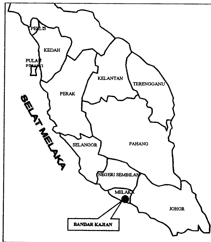
Rajah 1.2: Lokasi Bandar Kajian

masyhur sehingga pada pandangannya tidak ada tempat lain yang setanding dengannya pada ketika itu (Perbadanan Muzium Melaka, 1998). Di samping itu, seorang pembuat peta berbangsa German yang bernama Sebastian Munster telah membuat sebuah peta Semenanjung Tanah Melayu pada tahun 1552 dengan merujuk peta tersebut sebagai Melaka (Perbadanan Muzium Melaka, 1998). Semua ini menggambarkan kepada kita bahawa Melaka lebih terkenal berbanding dengan tempat-tempat lain di Tanah Melayu ketika itu.