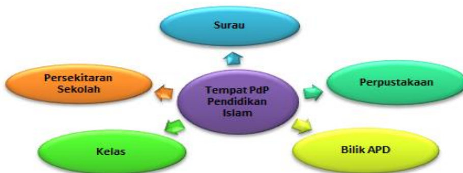
Rajah 1 Model Tempat Pengajaran dan Pembelajaran (P&P) Pendidikan Islam

Justeru, berdasarkan hasil dapatan kajian pengkaji menghasilkan satu model yang dinamakan Model Tempat Pengajaran dan Pembelajaran (P&P) Pendidikan Islam. Model ini digambarkan oleh pengkaji sebagaimana yang tertera pada Rajah 1.