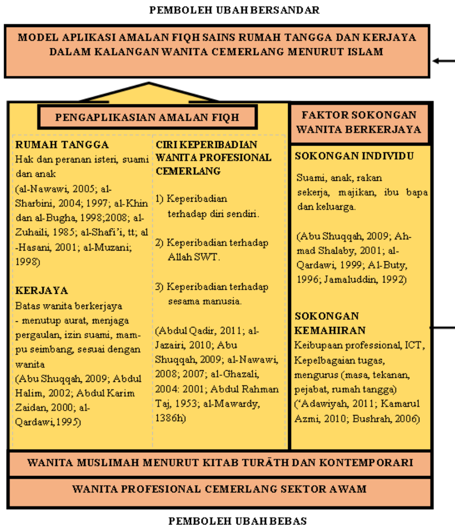
Rajah 1. 2: Kerangka Konsep Kajian Kualitatif Aplikasi Amalan Fiqh Sains Rumah Tangga dan Kerjaya terhadap Wanita Cemerlang Sektor Awam di Malaysia

Rajah 1.2 menunjukkan ringkasan penyelidikan dalam bentuk konsep kajian. Kecemerlangan wanita berkerjaya dan berumah tangga dalam Islam adalah bergantung kepada pemboleh ubah bebas melibatkan pengaplikasian amalan fiqh dalam kerja, rumah tangga dan keperibadian cemerlang. Sementara itu, faktor sokongan menjadi penguat kepada kejayaan seseorang wanita. Bentuk pengaplikasian ini didasari oleh pandangan ulama menerusi kitab turāth dan kontemporari. Hasil dapatan kajian ini berjaya menghasilkan model wanita cemerlang dalam kerjaya dan rumah tangga menurut kaca mata Islam.