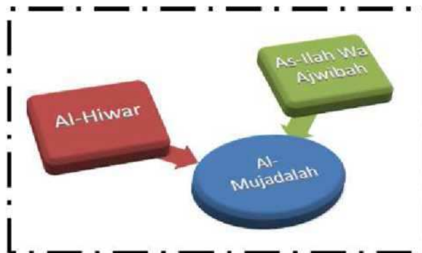
Rajah 3 Dakwah Al-Mujadalah