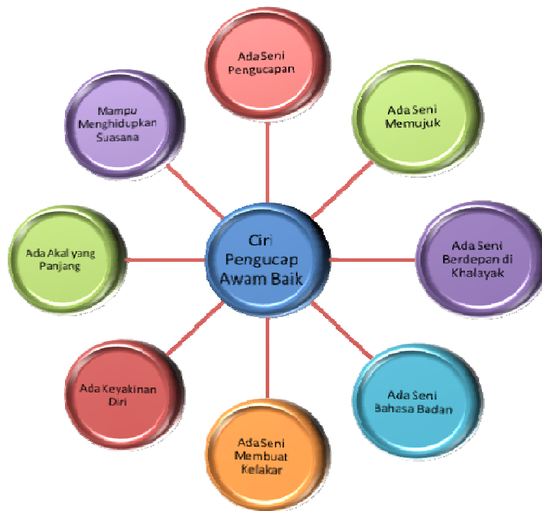
Rajah 7 Ciri Pembentang yang baik dan cemerlang menurut Tandon (2012)

Menurut Tandon (2012), pembentang yang baik mempunyai lapan ciri yang utama. Ciri-ciri ini menurut beliau adalah datang daripada pewarisan dan datang daripada latihan yang khusus. Ciri tersebut seperti yang digambarkan dalam Rajah 7.