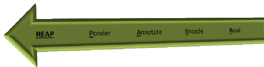
Rajah 4 Teknik Membaca REAP yang diperkenalkan oleh Tasdemir (2010)

Teknik terakhir kemahiran membaca ini diperkenalkan oleh Eanet & Manzo (1976). Berdasarkan teknik ini empat langkah perlu diambil, iaitu baca untuk mencerpai isi dan mesej yang ingin disampaikan oleh penulis, mengekodkan isi mesej tersebut kepada bahasa pembaca, membuat catatan dalam bentuk tulisan di buku atau alat elektronik, serta membuat refleksi terhadap isi dan mesej yang ditulis. Refleksi dilakukan melalui perbincangan kumpulan dalam memberikan pendapat pada bahan yang telah dikutip atau yang juga mempunyai persamaan dengan bahan yang telah dibaca.