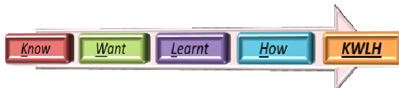
Rajah 3 Teknik Membaca KWLH oleh Ogle (1986) dan Weaver (1994)

Teknik ini diperkenalkan oleh Ogle (1986) dan Weaver (1994). Berdasarkan Rajah 3, penggunaan teknik ini dengan mahasiswa mesti menjawab empat persoalan daripada sesuatu teks yang ingin dibaca, iaitu apa yang diketahui, apa yang hendak diketahui, apa yang hendak dipelajari semasa membaca bahan bacaan, dan bagaimana maklumat tambahan yang diketahui dapat diguna dan diaplikasikan dalam penyampaian atau penulisan.