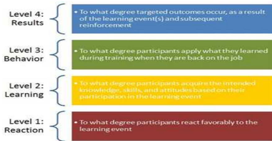
Rajah 1.2 : Model Kirkpatrik