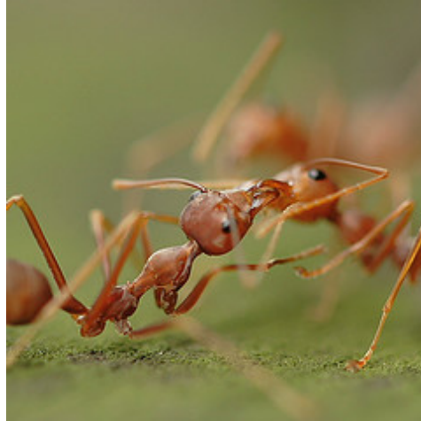
Gambar 2.1 Semut hidup dalam koloni