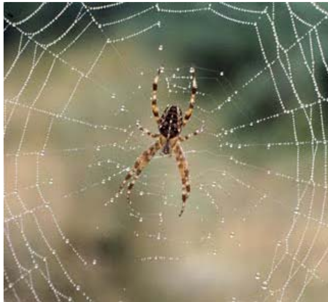
Gambar 2.3 Labah-labah dan sarangnya

Allah S.W.T. telah menyatakan bahawa rumah yang paling rapuh ialah rumah labah-labah. Hal ini demikian merupakan sindiran daripada Allah S.W.T. kerana walaupun bahan yang digunakan untuk membina sesawang sangat kuat, iaitu menyamai lima kali ganda kekuatan besi waja. Tetapi, labah-labah tidak mampu mencari perlindungan kerana mudah musnah apabila terkena tolakan daripada objek-objek yang kuat seperti kayu, angin yang kuat dan binatang-binatang besar bagi labah-labah jantan pula, mereka terpaksa menumpang di sesawang labah-labah betina. Semasa musim mengawan, labah-labah jantan merayu labah-labah betina tetapi selepas mengawan, labah-labah jantan akan dibunuh oleh labah-labah betina (Mohd Arip, 2007).