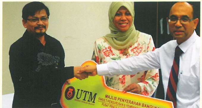
Majlis Penyerahan Bangunan FTI