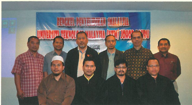
Bengkel Penyelidikan 1 Malaysia