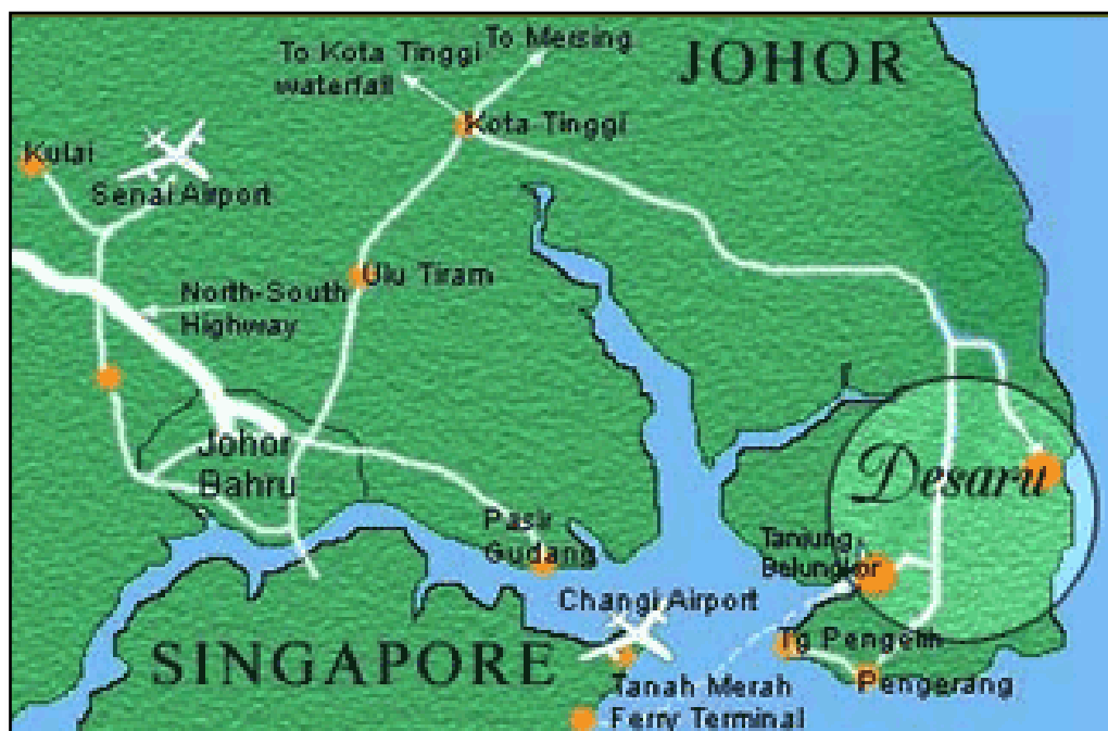
Rajah 1.2: Peta Kawasan Kajian Desaru

Desaru merupakan sebuah kawasan yang unik kerana di bahagian timur Desaru terbentang Laut China Selatan manakala Selat Tebrau pula terletak di bahagian selatannya. Kawasan Desaru adalah di bawah pentadbiran jajahan Kota Tinggi.