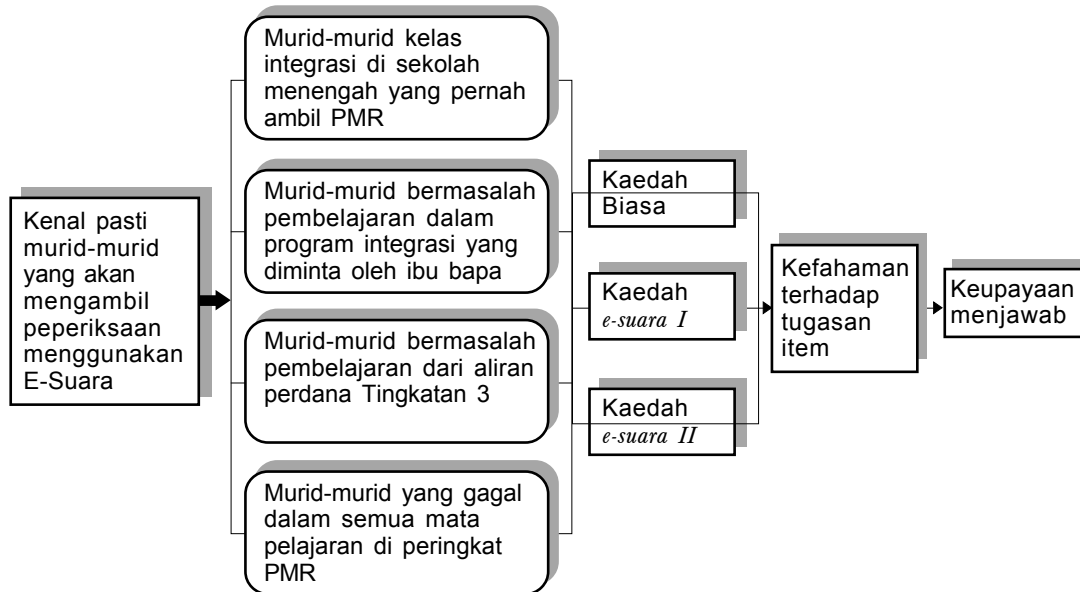
Rajah 1 Kerangka pemilihan sampel

memperkenalkan sebuah sistem pentaksiran bagi murid-murid pendidikan khas bermasalah pembelajaran. Asas pemilihan sampel pelajar pendidikan khas diperlihatkan melalui kerangka (Rajah 1) diadaptasi daripada model pentaksiran alternatif e-suara yang pernah diuji oleh murid-murid pekak oleh Lembaga Peperiksaan Malaysia, Kementerian Pelajaran Malaysia.