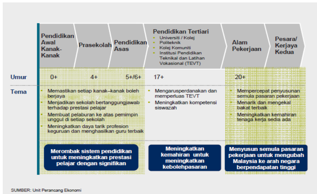
Rajah 1: Rangka kerja pembangunan modal insan bersepadu

Merealisasikan hasrat ini menjelang 2020, satu rangka kerja telah disusun bagi menentukan keberhasilan dan pencapaian yang ditetapkan. Melalui rangka kerja pembangunan modal insan yang bersepadu bagi Malaysia, dapat dilihat satu reformasi yang bakal menghasilkan satu perubahan besar kepada masa hadapan Malaysia.