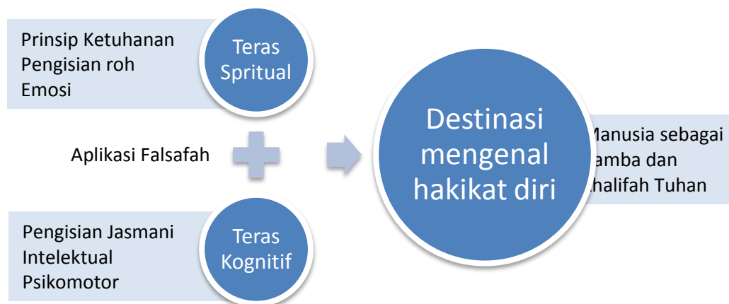
Rajah 1 Komponen dalam dua teras dan destinasi pelan reformasi PTV (diubahsuai daripada Model Pendidikan Bersepadu oleh Tajul Ariffin, 1993)

Melihat kepada kepentingan reformasi pendidikan yang meruanglingkupkan dimensi kerohanian sebagai intipati dalam memperkasa institusi pendidikan, maka alternatif dua teras dan satu destinasi dijadikan sebagai wadah dalam proses merancang pelan reformasi strategik Pendidikan Teknik dan Vokasional ke arah pembangunan sejagat. Dua teras yang ditekankan adalah teras spiritual yang mendasari falsafah ketuhanan serta teras kognitif yang berpaksikan kepada intelektual dan praktikaliti. Implimentasi kedua-dua teras ini akan membentuk sistem PTV yang universal dan mampu membimbing manusia untuk mencapai destinasi tertinggi pendidikan iaitu mengenal hakikat diri ( self-actualization ).