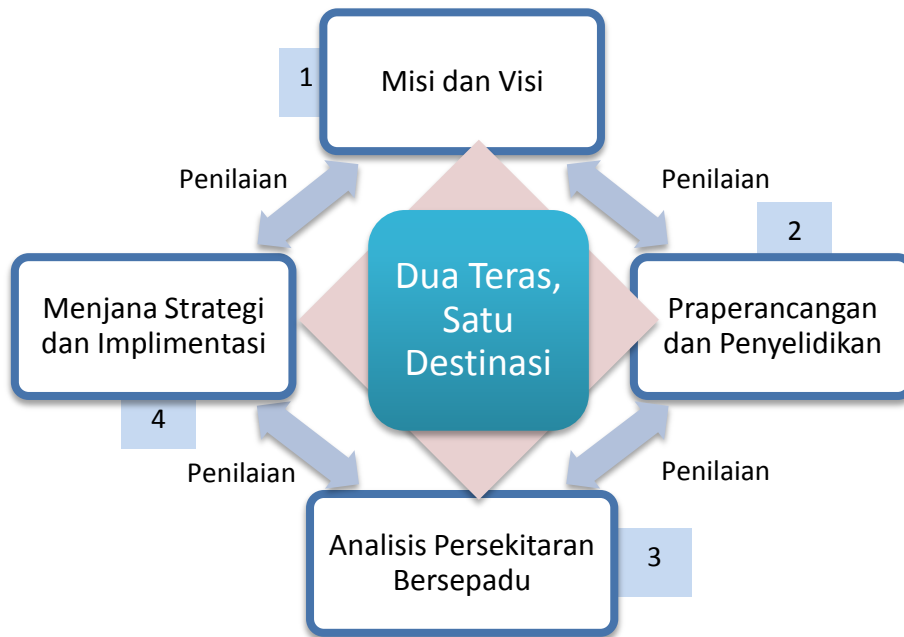
Rajah 2 Pelan Reformasi Strategik Pendidikan Teknik dan Vokasional (diubahsuai daripada Hairuddin dan Bustaman, 2009)

hubungan manusia dengan faktor persekitaran perlu ditransformasikan agar mampu menerapkan kesepaduan antara ilmu akal dengan ilmu wahyu.