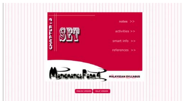
Rajah 1 Paparan Muka ( index )

Paparan Muka ( index ) Rajah menunjukkan paparan muka pertama ( index ) bagi laman web yang dihasilkan. Pada paparan ini, pengguna disediakan dengan suatu animasi ringkas yang memberi informasi tentang laman web yang akan mereka lawati. Pada bahagian bawah imej utama, terdapat dua button yang perlu dipilih oleh pengguna untuk meneruskan melayari laman web ini iaitu dengan memilih versi dwi bahasa yang dibekalkan. Pada button pertama, pengguna akan melayari laman web ini dalam versi bahasa inggeris manakala pada button kedua, untuk ke laman web versi bahasa melayu. Menerusi paparan muka ini juga, pengguna akan dapat melihat penggunaan warna dan grafik yang ringkas sebagai suatu pengenalan awal tentang laman web yang bakal dilawati.