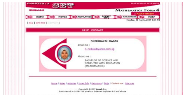
Rajah 3 Paparan Hubungi Saya

Paparan hubungi saya mengandungi gambar pembangun, nama, alamat email serta maklumat mengenai pembangun. Sekiranya berlaku kesulitan atau inginkan pertanyaan dengan lebih lanjut mengenai laman ini, mereka perlu menghubungi pembangun melalui e-mail yang diberikan.