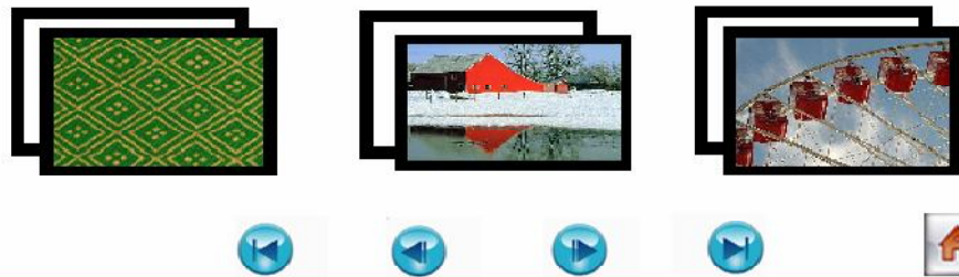
Rajah 2: Paparan Introduction